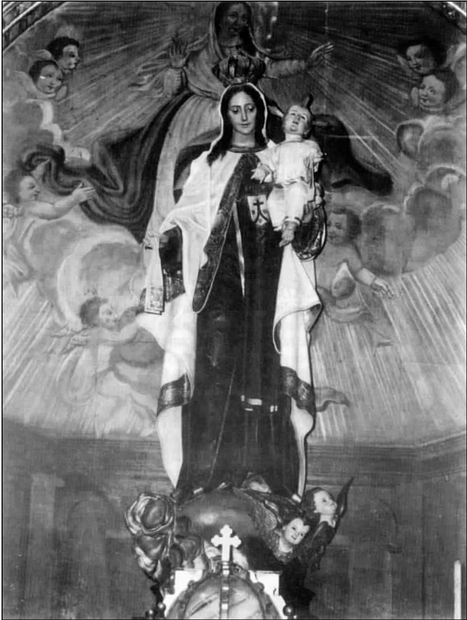
Imagen de Nuestra Señora del Carmen perteneciente a esta cofradía. En la actualidad preside el altar mayor de la Iglesia de Santo Domingo de Betanzos.