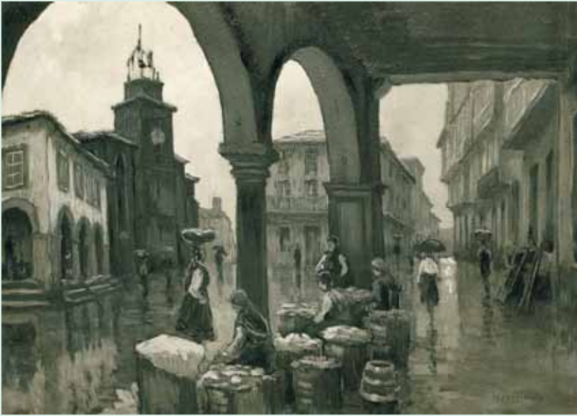
La exenta Plaza Mayor en 1940, óleo del célebre pintor don Francisco de Asís Planas Doria. Foto de F. Ribera, de Barcelona. Archivo del autor.

Es decir que cuando menos una parte de la casa la mantenían en alquiler, y por otro lado manifestaba que transcurridos treinta años el edificio se hallaba derruido; un relato veraz sobre la situación en que se encontraba la ciudad a resultas del incendio de 1616, y lectura evidente de la triste realidad, en la que cabe preguntarse: si la nobleza no había reconstruido sus casas transcurridos treinta años, ¿qué pasaría con las del pueblo llano? La respuesta es muy sencilla, unos venderían sus «plazas» al abandonar la ciudad, otros vivirían de alquiler, algunos construirían «ranchos», y los más afortunados las levantarían de nuevo. En todo caso, una pérdida irreparable.