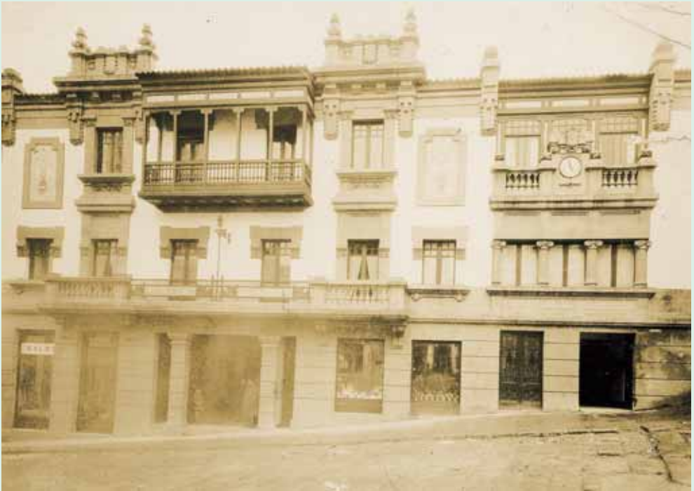
En el antiguo solar de los Figueroa en Betanzos, se levantaba en 1923 la Casa Núñez, obra del ilustre arquitecto don Rafael González Villar. Foto de época de don Antonio Núñez Díaz, del archivo del autor.