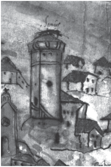
La torre de Vilousaz o de Lanzós, en el plano de la ciudad de Betanzos realizado por Antonio Vázquez de Castro en 1616. Archivo Histórico Nacional, Consejos, sig. 43.581. Publicado por Baudilio Barreiro y Ofelia Rey, en el Anuario Brigantino de 2010.