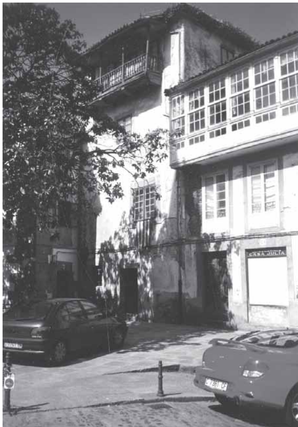
La torre de Vilousaz o de Lanzós en 2005.

Únicamente nos resta señalar que esta torre esta considerada Bien de Interés Cultural, en el corazón de una ciudad declarada Conjunto Histórico Artístico desde el 31 de diciembre de 1970.