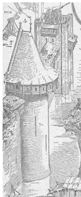
Una de las torres de la ciudad francesa de Carcassonne con su cadalso, y dibujo publicado por su restaurador Viollet-le-Duc, en su Dictionnaire Raisonné de L'Architecture, París, s. XIX, pág. 363.

En el último tercio del mismo siglo habrían de realizarse importantes reformas, que contarían con la intervención de Domingo de Monteagudo 7 , afamado maestro cantero vecino de Santiago, residente en Betanzos, donde era contratado por don Bernardino de Lanzós, II Conde de Maceda, el 22 de septiembre de 1673, por ante el escribano Gregorio de Castro: