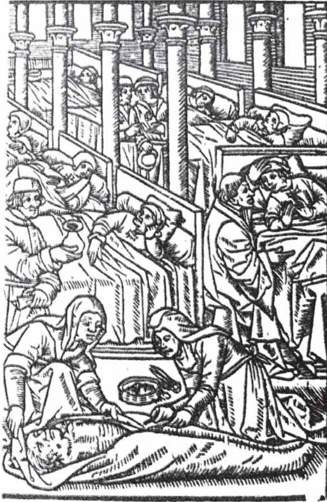
Interior de un hospital del siglo XV.

En el apartado de la relación dedicado al arcedianazgo de Nendos, el primer hospital que nos interesa es el de Santa Catalina 2 con capilla y ubicado en el puente de Sarandones, cuya renta se encontraba el litigio con la carga de dos misas semanales.