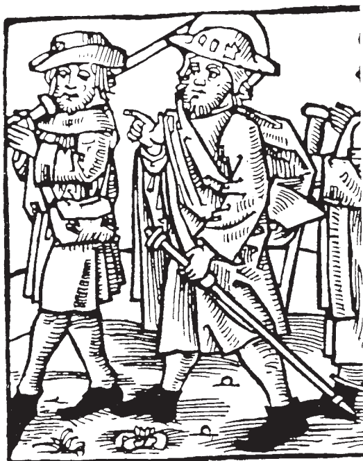
Peregrinos. Grabado del siglo XV.

Le sigue el de Nuestra Señora de la Anunciación o de la Anunciata de Betanzos, en buen estado por haber sido restaurado, tras el incendio general de la ciudad del año 1569, merced a la cesión de las Penas de Cámara que se recaudaran en la ciudad por el Rey Felipe II (Vid. Apéndice I). Figura este hospital labrado en piedra, con una capilla de dos altares y cimborrio, suficiente renta y aposentos con dormitorio para los enfermos y para el servicio.