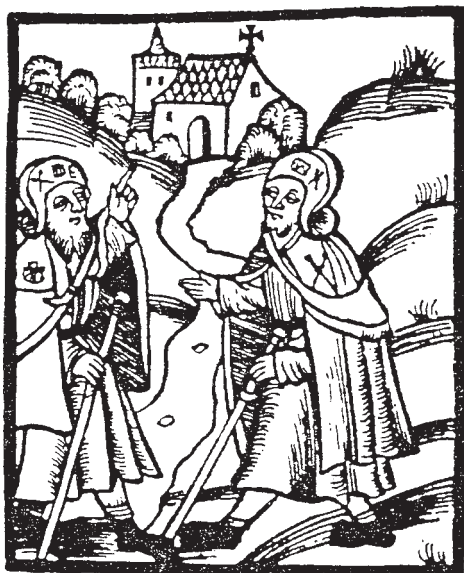
Peregrinos. Grabado del siglo XV.

Extraídas de la Relación formada por el Arzobispado de Santiago a finales del siglo XVI