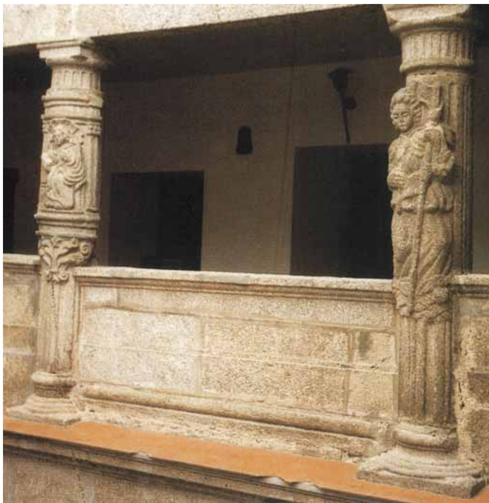
Claustro del antiguo hospital de Nuestra Señora de la Anunciación. En una de sus columnas se halla marcada la vara de medir de Betanzos.

El resumen de esta relación, viene a manifestar la conveniencia de mantener estos hospitales en los lugares de origen, por el buen servicio que prestan a los pobres, y por el ejemplo que suscitan en las gentes piadosas, pues «nunca falta quien les aze limosna» .