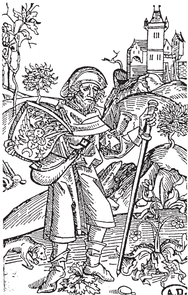
Peregrino. Grabado del siglo XV.

Los hospitales de la relación, tienen que ver con la ruta inglesa del Camino de Santiago, y de la variante del camino francés que derivaba hacia Oviedo y que por Ribadeo, Mondoñedo y Villalba, confluía en el Santuario de Nuestra Señora del Camino de Betanzos con el procedente de Ferrol y Neda, de manera que nuestra ciudad llegó a ser paso obligatorio a la vez que alternativo de los Caminos de Santiago, de ahí la necesidad de este tipo de centros asistenciales, en los que cuando menos se ofrecía lecho y fuego, en ocasiones acompañados de pan y vino, y cuidados profilácticos, debido como veremos a la escasez de sus rentas.