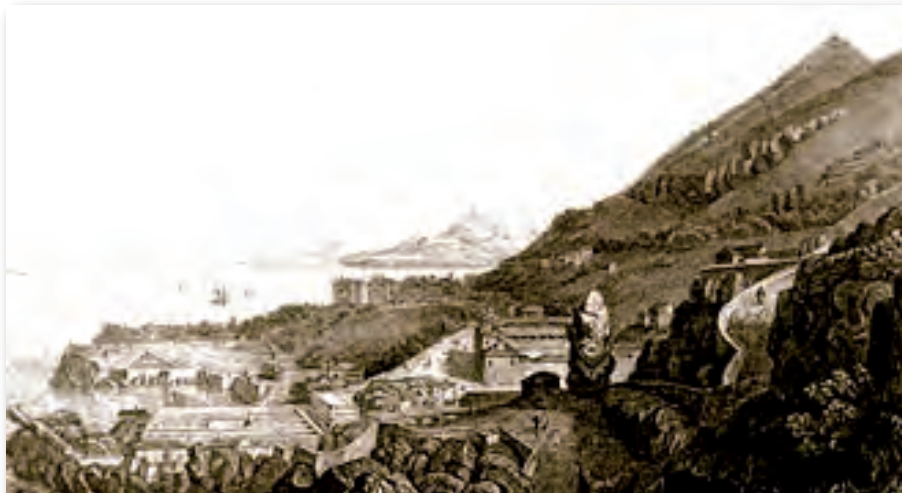
La ciudad de Gibraltar en 1828. Obsérvese a la izquierda el Muelle Nuevo, donde arribó el "Joven Casimiro". / Grabado (Madrid, Biblioteca Nacional).

Al día siguiente el capitán se persona en el Consulado de España y presenta una "Protesta" sobre lo acontecido, y obtiene del Cónsul una certificación en la que se hacen constar estos sucesos pormenorizados. En aquella plaza colonial permanecerán durante catorce días para atender los reparos del bergantín (Vid. Apéndice III).