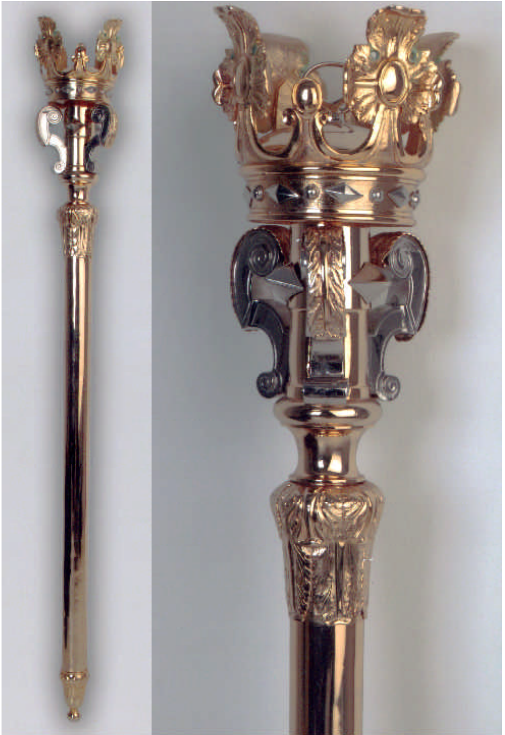
Las mazas de la ciudad de Betanzos.