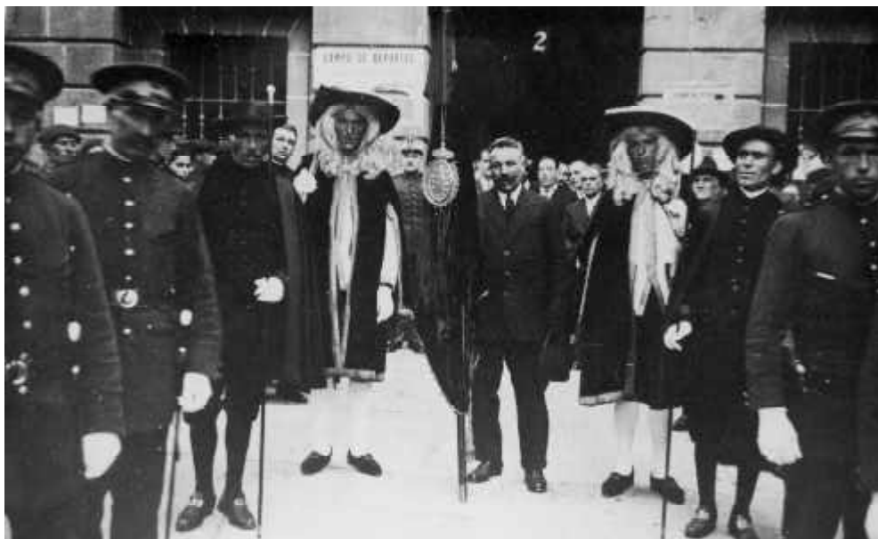
La Excma. Corporación Municipal con el pendón, maceros y alguaciles, a la salida del ayuntamiento en 1929. Archivo del autor.