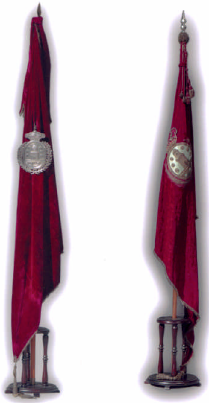
Los dos pendones de la ciudad de Betanzos.