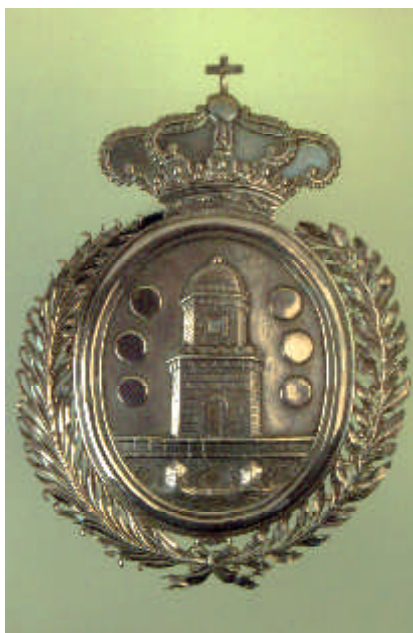
Escudo de Betanzos confeccionado en plata en el siglo XIX, perteneciente a uno de los pendones de la ciudad.

Debido a su obligada utilización en los actos oficiales, y con el fin de asegurar su buena conservación en el futuro, es aconsejable la confección de una réplica que cumpla estas funciones. En cuanto al pendón antiguo, para garantizar su permanente conservación y exposición y sobre todo para librarlo de las influencias de los cambios meteorológicos que padecemos, recomendamos su instalación en una vitrina debidamente acondicionada, para ser situada con el resto de las insignias de la ciudad en la Sala Capitular del Palacio Consistorial.