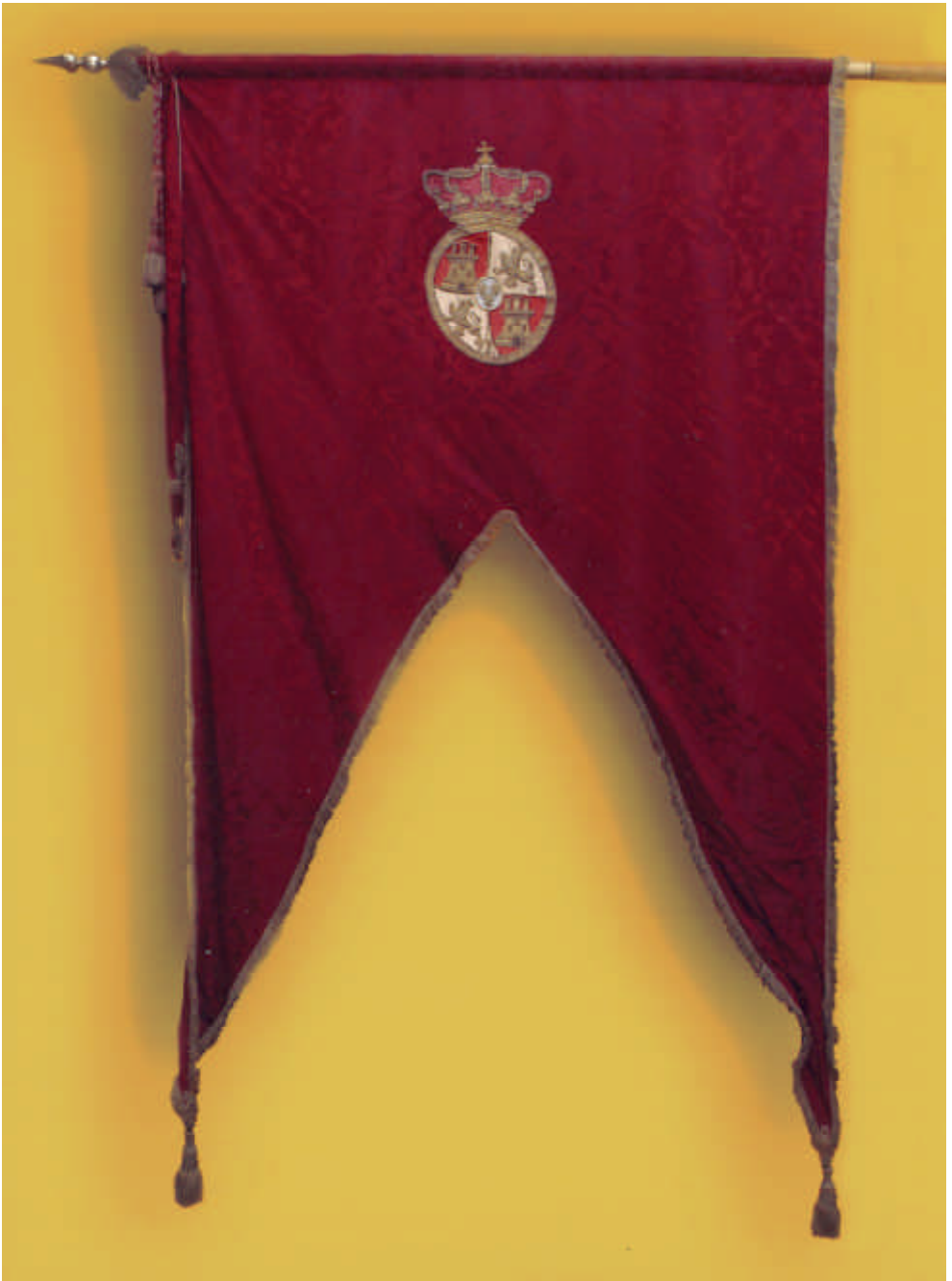
Pendón Real de la ciudad de Betanzos, por el lado en el que figuran las armas reales.