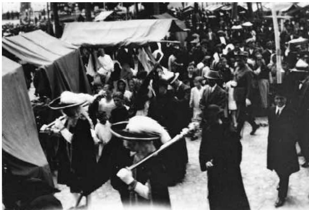
Los maceros que custodian el pendón Real de regreso de la Función del Voto, en la segunda década del pasado siglo.

ydispensable y sustancial para berificar el Cuerpo Zivil de una Ciudad, siempre que como tal salga o se presente en qualquier funcion publica, el que lleve las Mazas» 30 .