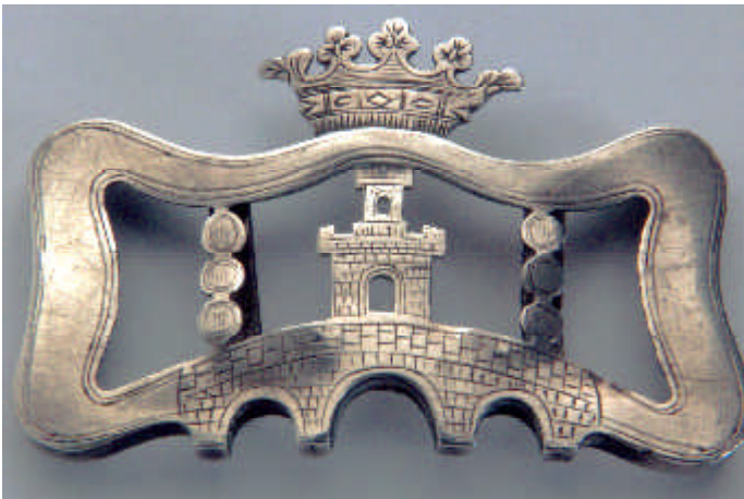
Una de las hebillas de plata que lucen los alguaciles en sus zapatos con las armas de la ciudad, pertenecientes al siglo XIX.