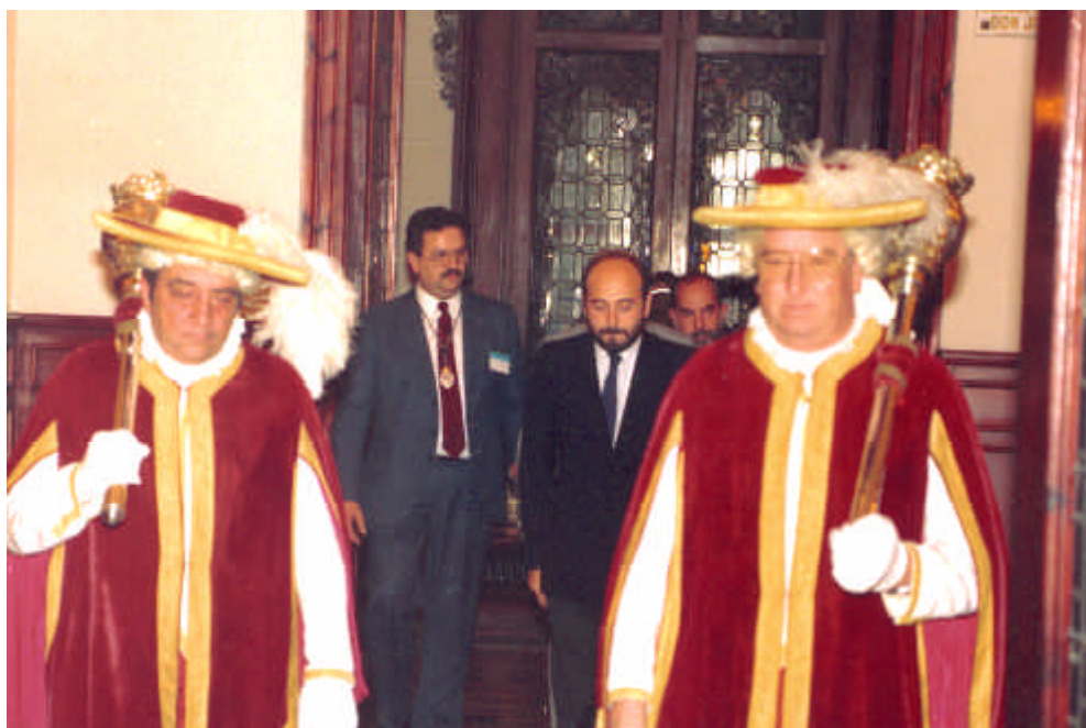
Los maceros del ayuntamiento de La Coruña lucen las mismas galas que los antiguos de la ciudad de Betanzos. La imagen está tomada durante la recepción a los cronistas oficiales de España, en Octubre de 1987.