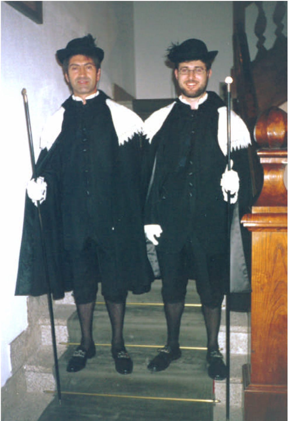
Los alguaciles del ayuntamiento de Betanzos en la actualidad.