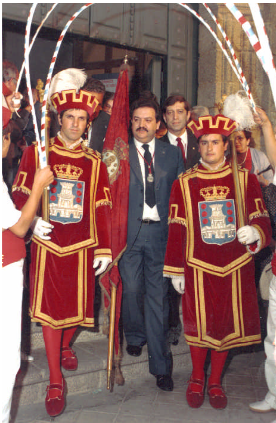
Los maceros del ayuntamiento de Betanzos con los vestidos adquiridos en Madrid en 1961. En el centro aparece el autor con el pendón, a la salida de la Función del Voto en 1983. (Foto Fersal).