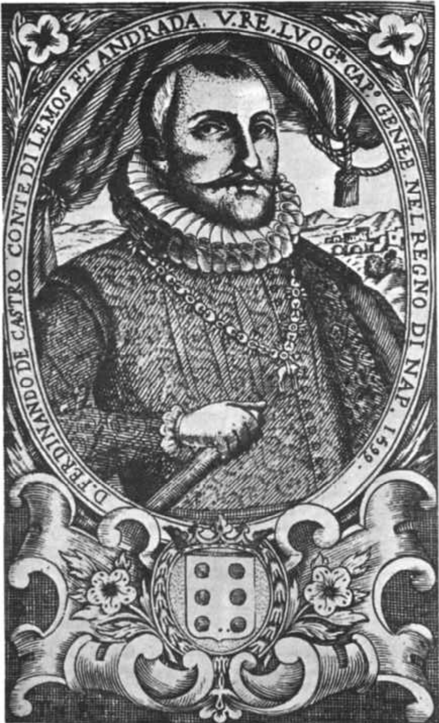
Don Fernando Ruiz de Castro, sexto conde de Lemos y Alférez Mayor de la ciudad de Betanzos.