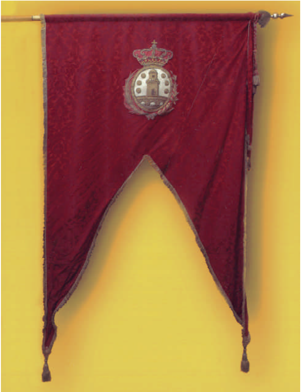
Pendón Real de la ciudad de Betanzos, por el lado en el que figuran las armas de la ciudad.