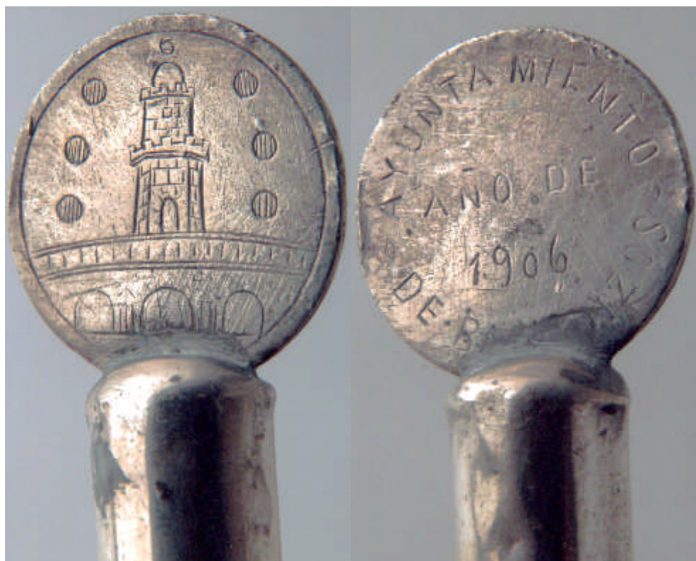
Anverso y reverso del remate de las varas de los alguaciles de la ciudad de Betanzos.