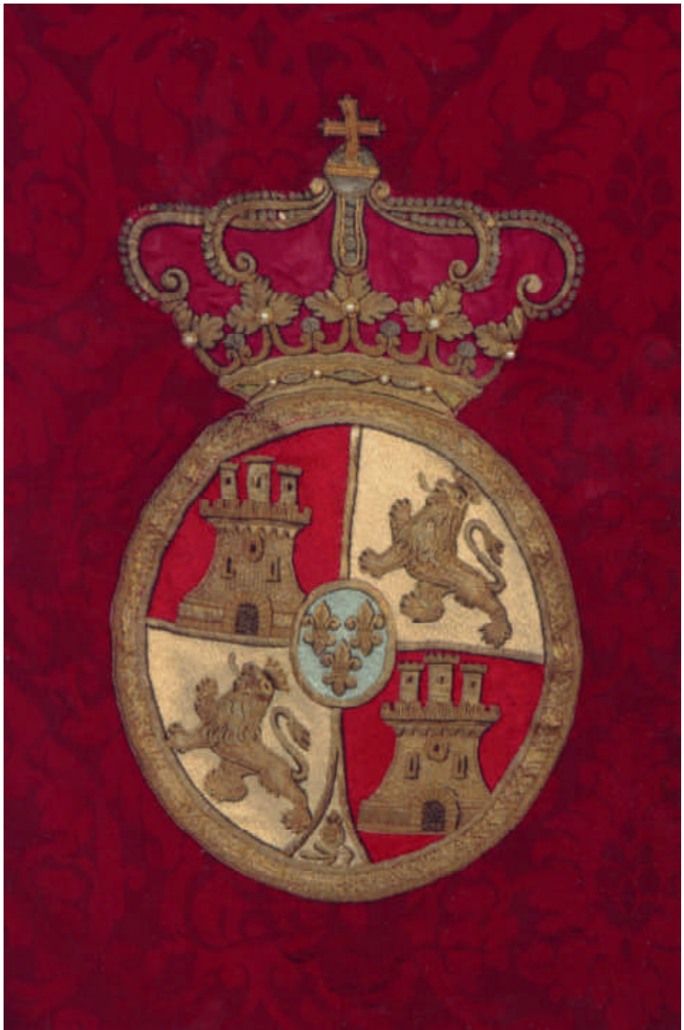
El escudo Real que figura en el pendón de la ciudad de Betanzos.