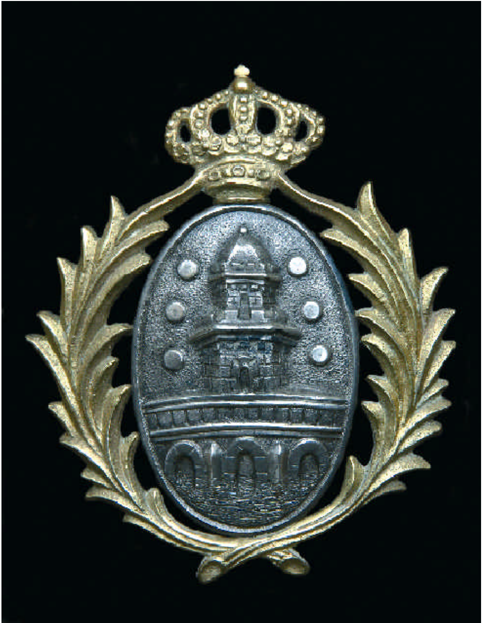
Broche con el blasón de la ciudad que lucían los maceros prendido en el frente de la copa de sus sombreros.