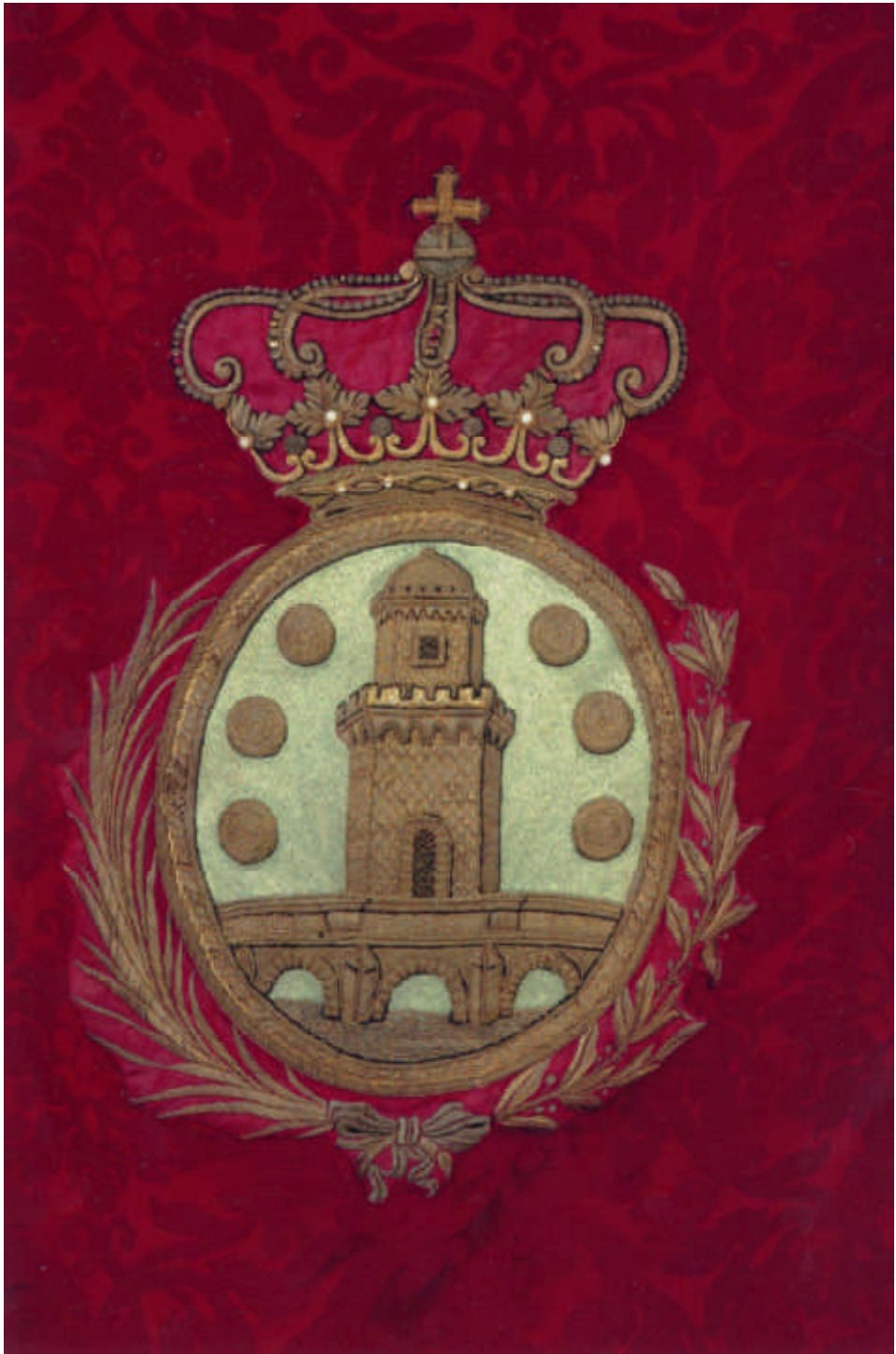
El blasón de Betanzos que figura en el pendón de la ciudad, con la palma y el laurel triunfales.