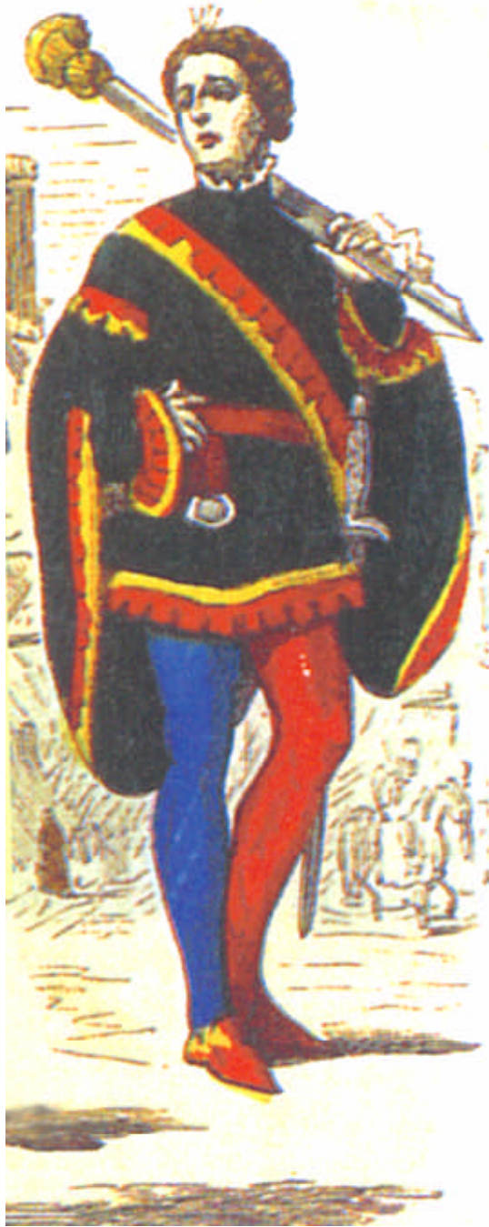
Alguacil con maza, en una recreación decimonónica francesa del mundo medieval.