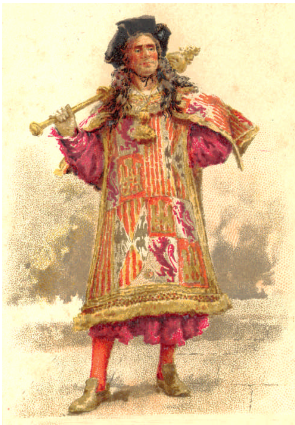
Macero por Pradilla, siglo XIX.