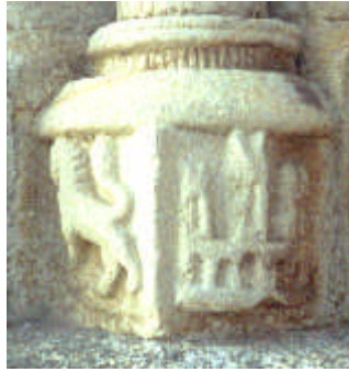
Pórtico de San Francisco. Armas de León y Castilla.

Nos honra el poder asegurar que la ciudad de Betanzos, antigua Capital del Reino de Galicia, es la única que ha mantenido en todos los actos en los que interviene « en forma de Ciudad », los alguaciles que la dignifican, con las insignias que nuestros antepasados pusieron en sus manos, como símbolo de continuidad de la historia local, y como muestra inconmensurable de la tradición que nos guía.