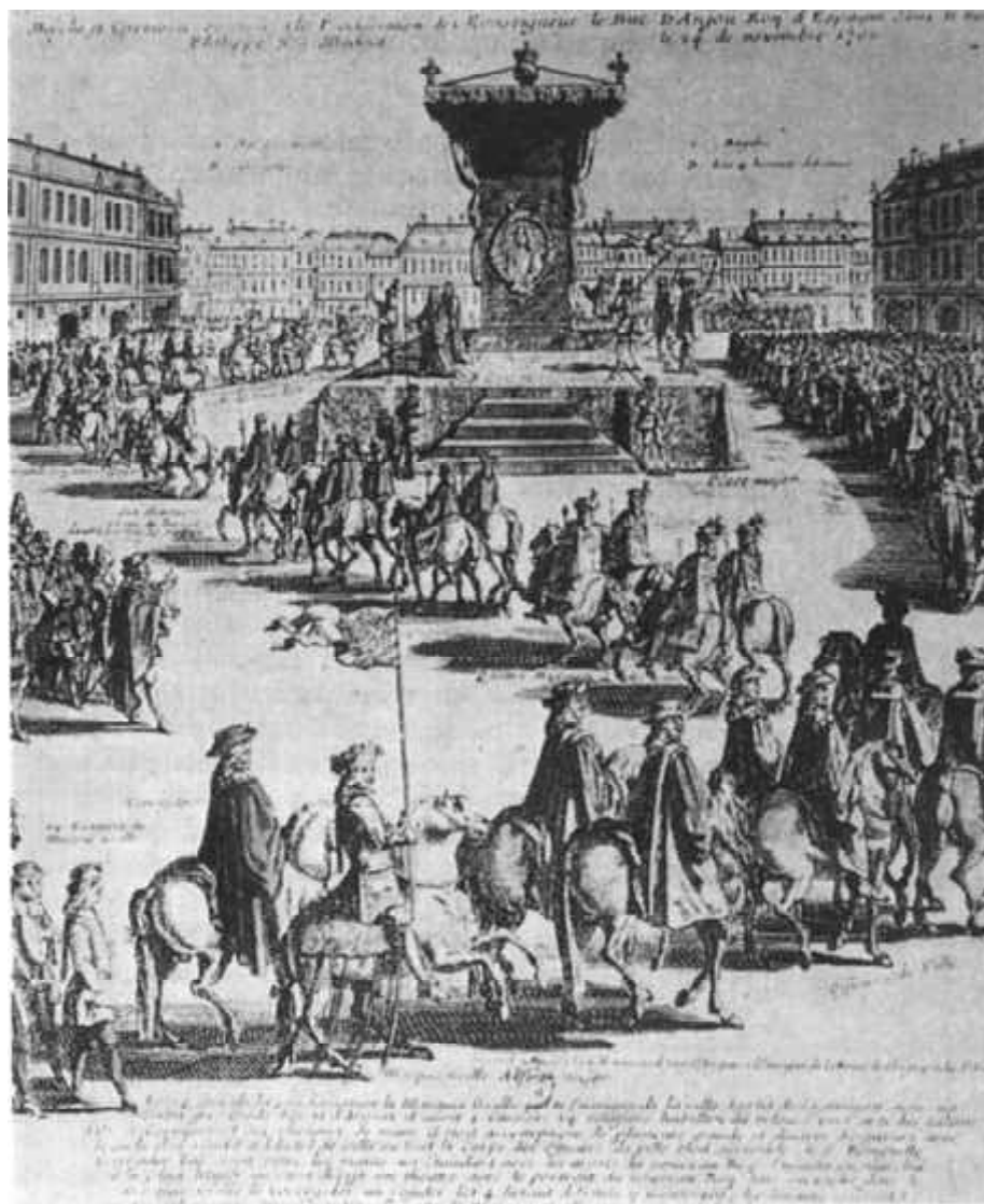
La proclamación de Felipe V en Madrid.