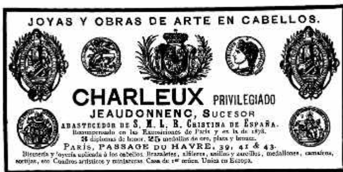
Anuncio del siglo XIX de la casa Charleux de París, especializada en la realización de piezas al estilo de las que figuraban en los sombreros de los antiguos maceros.

Es preciso recobrar el genuino vestido de nuestros maceros, como único medio para restablecer la representación histórica de la Excm. Corporación Municipal.